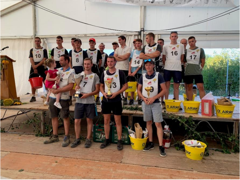
Les vainqueurs du concours de labours, sélectionnés pour la finale régionale.