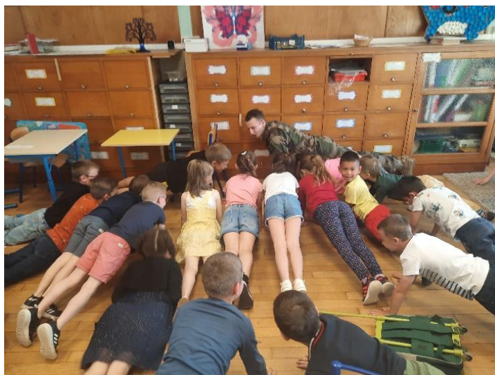
Les pompes... apprentissage...

Merci au 53 e RT pour cette heureuse initiative.